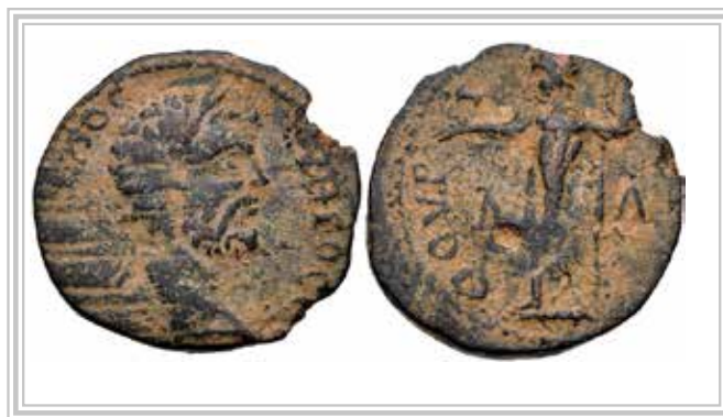
Dea Cypria - Dea Syria